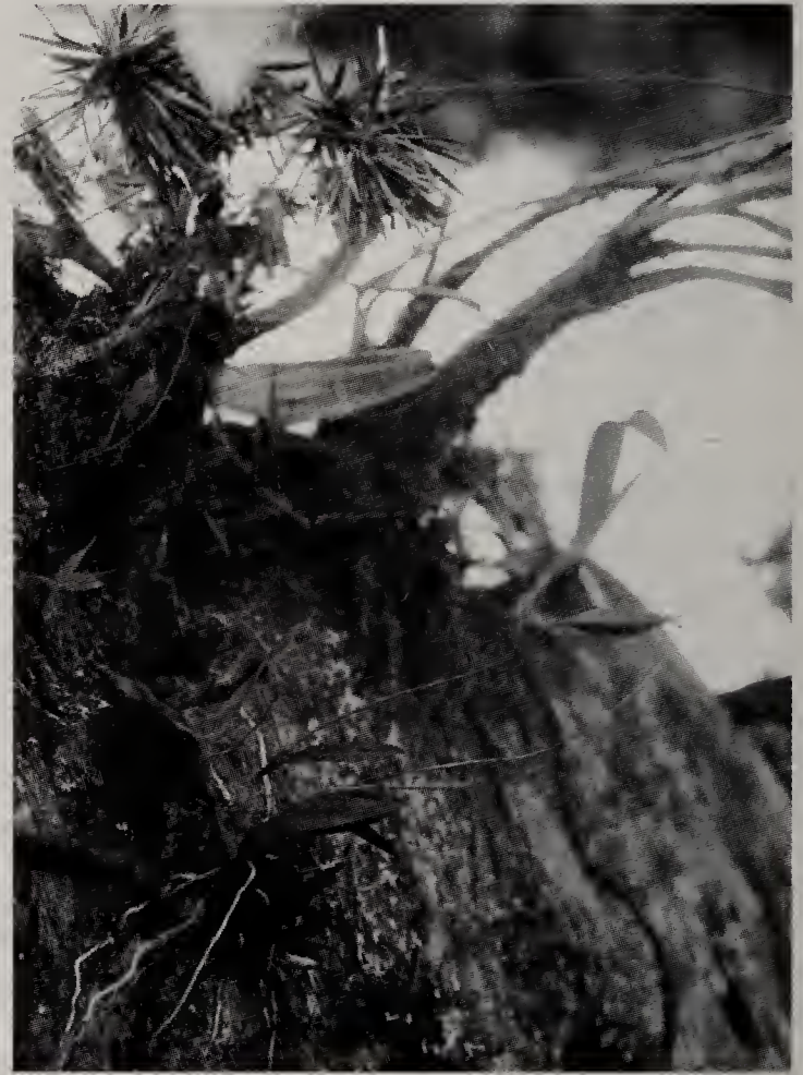
H. pendula in situ (en fruit)